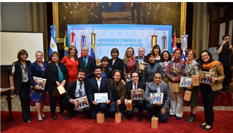
Fundadores de la OID, Buenos Aires, septiembre 2014.