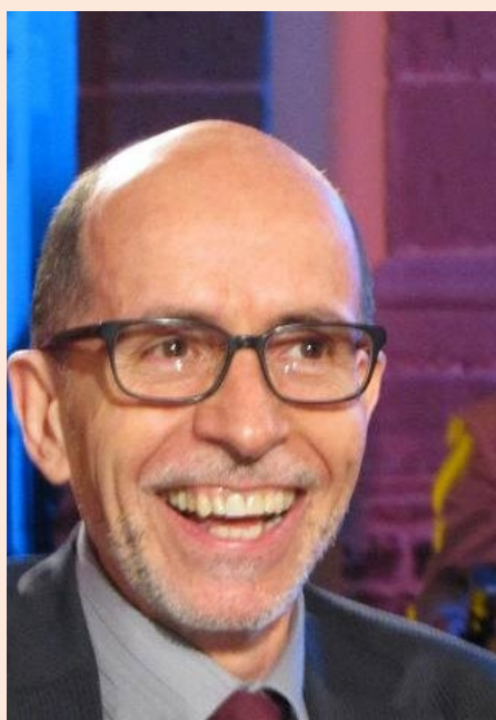
Miguel Sarre, primer Ombudsman mexicano.

A esta Defensoría escribió el maestro Miguel Sarre para presentar una queja porque a su parecer los spots de los aparatos auditivos de la empresa Audiotech, que se transmitían en Noticias MVS eran engañosos, ya que se presentaban “en formato de una amable entrevista, cuando en realidad es un anuncio comercial”. Y agregó: “Esta forma de publicidad encubierta es desleal con el radioescucha y merma la credibilidad de las auténticas entrevistas en detrimento de su valor periodístico”.