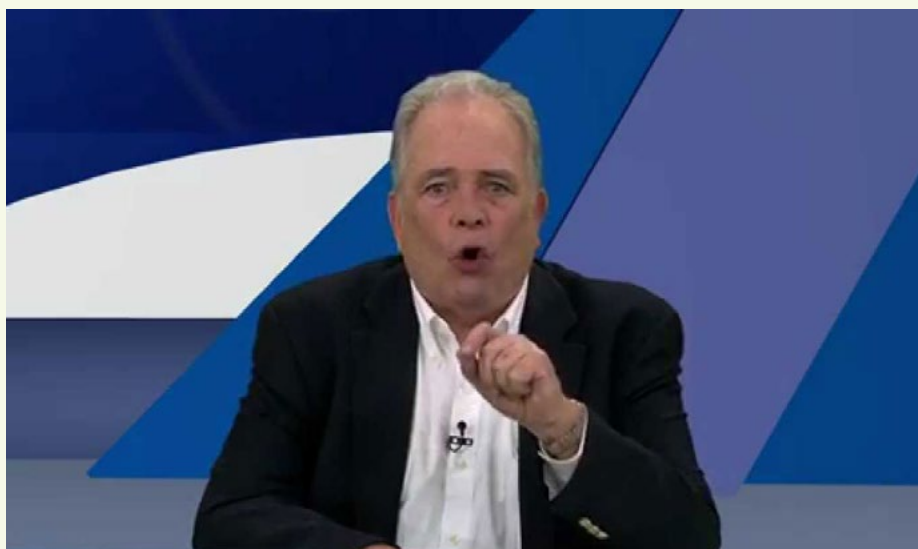
“El Defensor puede ejercer su oficio de intermediación”.